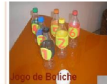
Jogo de Boliche

Fácil e você mesmo pode fazer. Divirta-se !