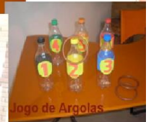
Jogo de Argolas